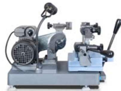
Profondeur/ Tiefe : 245 mm.