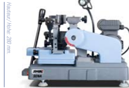
Hauteur/ Höhe: 280 mm.